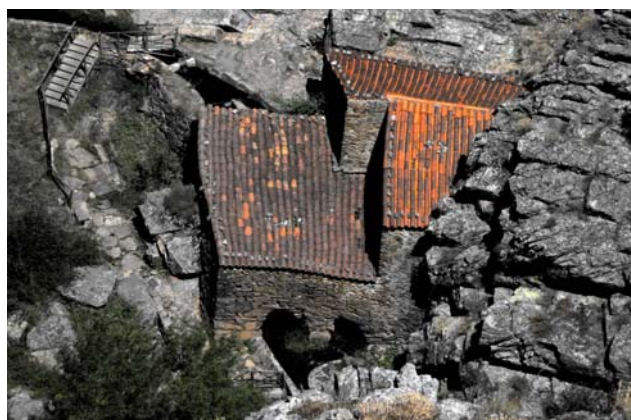
1ª Classificada (3ª categoria) – “Onde está o coração?”

Teremos novidades, principalmente para as alunas que querem iniciar-se neste hobby e que pensam que “não têm jeito”.