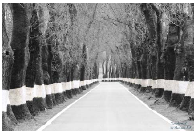
1ª Classificada exequou – “Lonely Road”