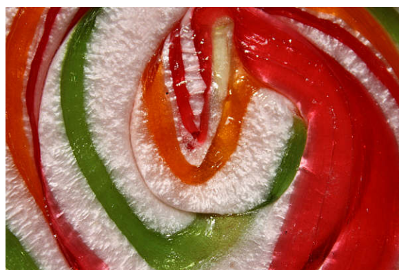
3ª Classificada (3ª categoria) - “Convívio”